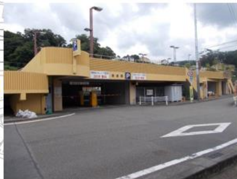
A 相模湖ふれあいパーク時利用駐車場出入口