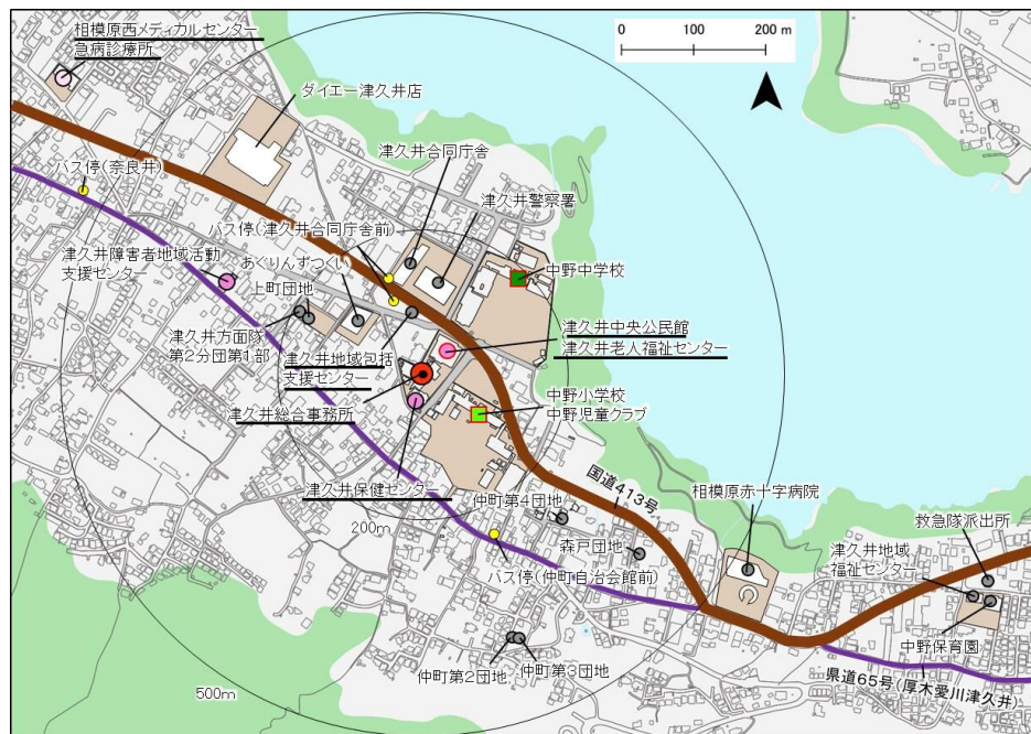
図 2-2 検討対象施設の配置状況